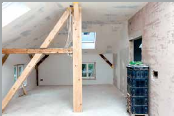
3. Knauf Diamant Trockenbauplatten in den Zwischenbereichen montieren und verspachteln