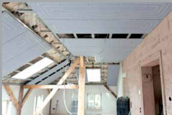
1. Uponor Renovis Panels auf CD Profile montieren