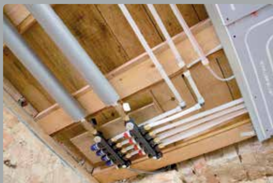
2. Anschluss an das Zuleitungsnetz durch das SHK-Fachhandwerk